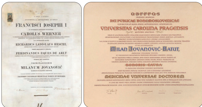
Слика 4. Дипломе др Милана Јовановића Батуга

Заоставштину др Милана Јовановића Батуга у Архиву САНУ, чини, између осталог, неколико штампаних публикација из 19. века, на српском језику, о медицини и болестима, једна стара штампана књига о женским болестима на француском ( Des Maladies des femmes ) из 1668, те Pharmacopoea Austriaco-provincialis emendata из 1794. У овој збирци чува се и рукописно дело Георгија Продановића под називом Књига о лекарсџву , из 1845. године, са мноштвом народних лекова против различитих обољења и тежба. Овде се чува и фотокопија штампаног текста из Требника Молебноје ње-није о недужних мнојих на црквенословенском језику са текстом молитве за свакују немошч у наставку ког постоји више записа народних мелема и лекова на вернакулару јужног српског ареала. Најнеобичнији, а може се рећи и најегзотичнији део ове целине чини 13 рукописних лекаруша на османском језику, писаних арапским словима, црним и црвеним мастилом, изузетне лепоте (сл. 5). Најзначајнији део некњижне заоставштине Милана Јовано-