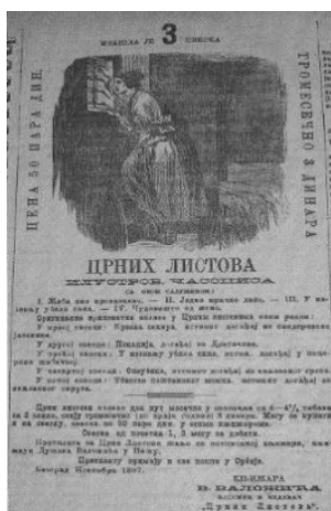
Илустровани часопис Црни листови