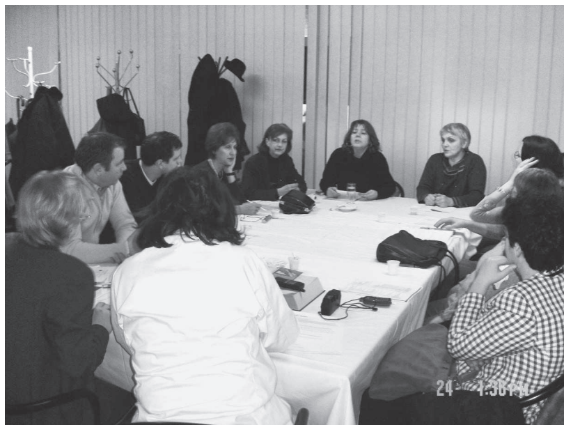
Osnivačka skupština, biblioteka Opće bolnice „Abdulah Nakaš”, februar 2006. godine

Asocijacija BAM je registrirana da djeluje na teritoriji BiH u skladu sa Rješenjem Ministarstva pravde Bosne i Hercegovine . Glavni cilj djelovanja Asocijacije je rad na uspostavljanju bliže saradnje između biblioteka, arhiva i muzeja u Bosni i Hercegovini, širenje naučne i stručne misli, podsticanje međunarodne saradnje, kako bi se provela zaštita, dostupnost, istraživanje, promocija i širenje informacija o kulturnoj i naučnoj baštini uz primjenu novih tehnologija i međunarodnih standarda.