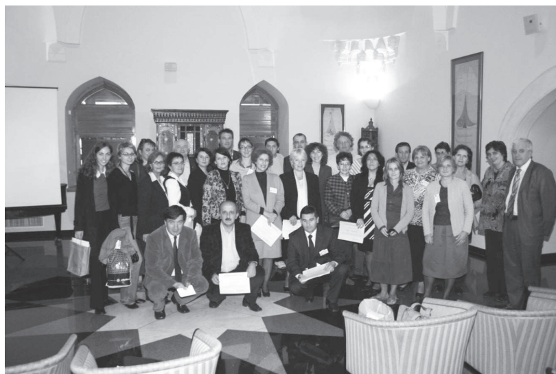
Učesnici 1. konferencije BAM 2007 u Bošnjačkom institutu