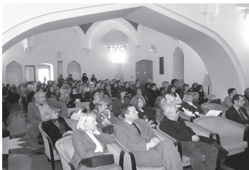
Učesnici 3. konferencije BAM 2009 u Bošnjačkom institutu