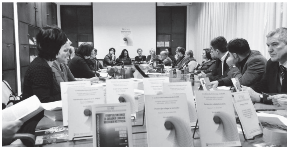
Učesnici Izborne skupštine na Šumarskom fakultetu u Sarajevu, februar 2016 godine