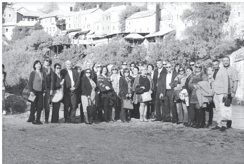
Slika br. 12: Učesnici 9. konferencije BAM 2016 u Mostaru

Zaključci i preporuke sa BAM konferencija se objavljuju u Zbornicima radova i postavljaju na web-stranicu BAM-a, a obavezno se dostavljaju u pisanoj formi resornim ministarstvima, relevantnim institucijama i medijima.