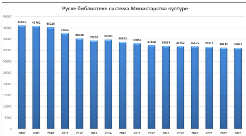
Слика 3. Промена броја библиотека у систему Министарства културе Русије (искључујући несамоствалне структурне јединице које обављају библиотечку делатност) у периоду 2008–2023 године. 4

Континуирани пад издавачке продукције има директан утицај на све институције повезане са дистрибуцијом и складиштењем штампаног материјала. Ово се односи на књижаре и библиотеке, чији број у Руској Федерацији у последњих деценију и по константно опада (Слика 3).